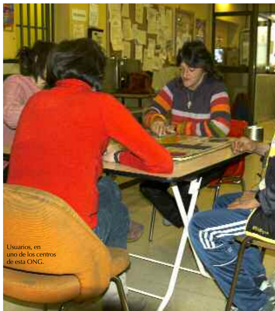
Usuarios, en uno de los centros de esta ONG.