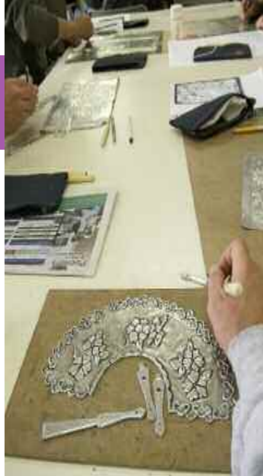
Reclusos, en el taller de manualidades.