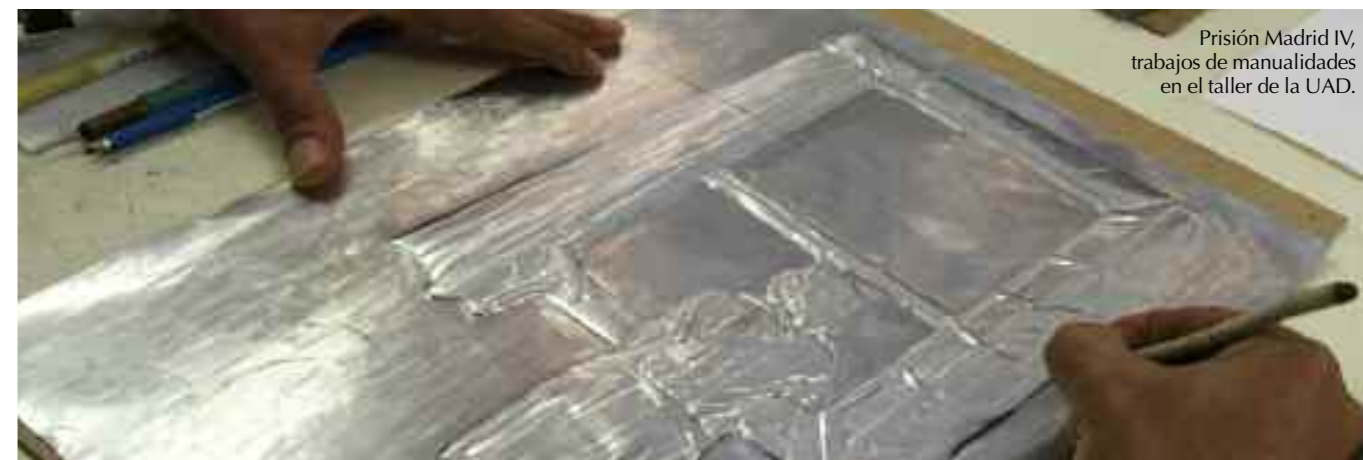
Prisión Madrid IV, trabajos de manualidades en el taller de la UAD.

Y, hablando de solidaridad: las ONG dedicadas a la infancia llegan al corazón, pero vosotros trabajáis con los más desfavorecidos, con la cara menos agraciada de nuestra sociedad (emigrantes enfermos, drogodependientes, presos...), ¿cómo lográis despertar el sentimiento solidario? La sensibilidad social va por otros lados. La televisión, por ejemplo, nos ha puesto el mundo más a nuestro alcance, pero las cercanías cada vez más lejos. Es la contradicción de la época: nos emociona el dolor lejano y miramos para otro lado ante el más