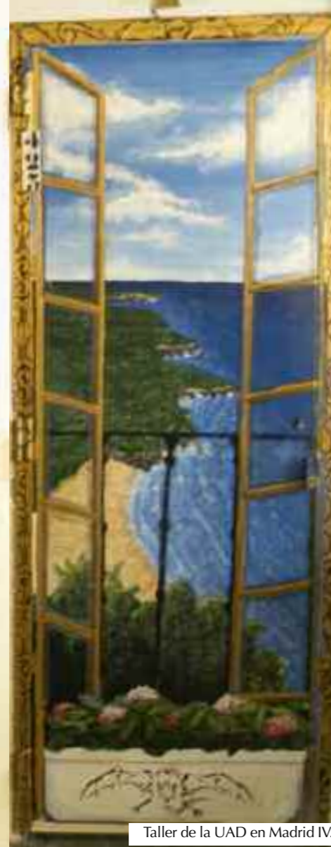
Taller de la UAD en Madrid IV.

Más de 150 presos de los módulos 3 y 4 luchan por superar su adicción en la UAD, un recurso de la Agencia Antidroga gestionado por esta ONG.