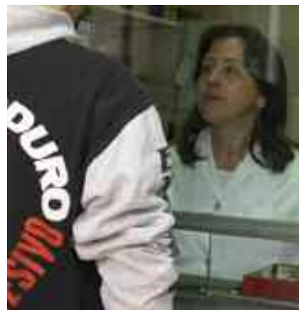
La metadona se dispensa en el laboratorio.

“Siempre que uno quiera no drogarse, el programa sirve para mejorar la vida. Los profesionales te ayudan, frente a la depresión, a encontrar salidas...”, asegura A., un pintor de 32 años que lleva más de 6 acudiendo al servicio de metadona.