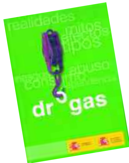
Esta guía es gratuita y puede conseguirse en las farmacias.

✓ La heroína ha sido sustituida por sustancias como el cannabis, la cocaína o el éxtasis, combinadas entre sí o mezcladas con alcohol y tabaco.